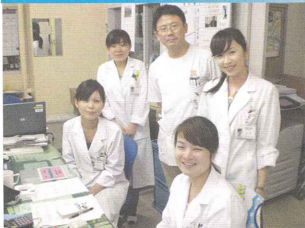
栄養管理部長 溝上内科診療部長（中央）

今後も、身体はもちろん、気持ちも元気になるような食事提供・栄養管理に努めていきます。