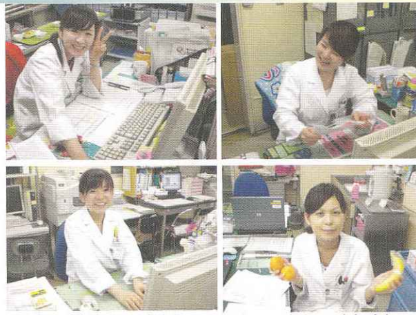
管理栄養士4名はいつもにこやか（^^）