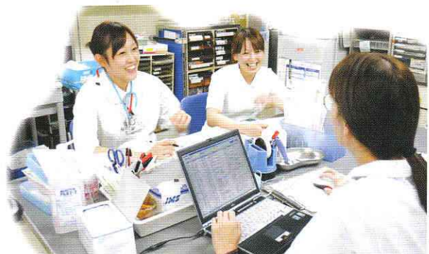
【チームワーク抜群です！】