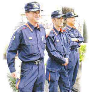
[消防局警防課のご協力もいただきました。]

療中に災害が発生し、医療資器材の準備など、すばやく受け入れ体制を整えること」を新しい目標として設定しました。