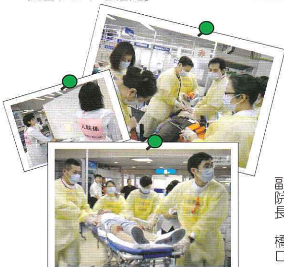
[院内での救命処置、入院などの情報把握。訓練の中で多くの反省点を見出しました。]