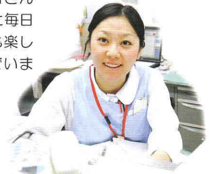
【病棟一の 元気な看護師さん！】

ベッド調整を行なっています。また入院患者さんにおいては満足していただけるようなケアを心がけ、助け合って働いています。困っていることは、色んな科のDrが主治医であるため指示受けが大変なことです。それでも多様な疾患の患者さんと多くのDr方と毎日忙しいながらも楽しく仕事に励んでいます。