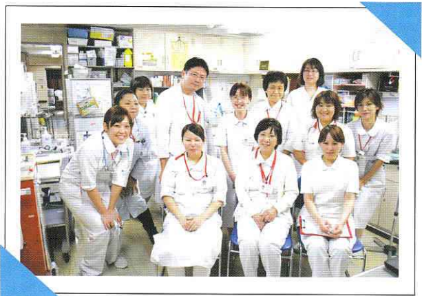
【6階東病棟スタッフ】