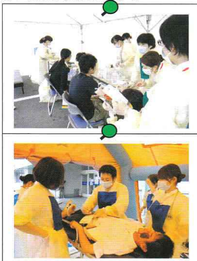
[第1・第2トリアージ ※第2トリアージは消防局の災害テントを借用]

反省会では、「資器材の保管場所がわからない。」「各現場で資器材が不足。準備不足だった。」