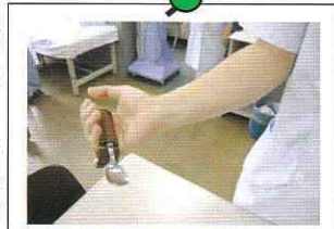
【図:手作りの改造スプーン】