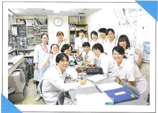
【6階西病棟スタッフ】